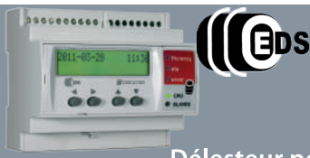
EDS Délesteur personnalisé (prioritaire, cyclique, etc.)

LE TARIF BLEU LE TARIF JAUNE Jusqu'à 250kVA (400A)