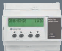
MDC-20 Optimiseur d'énergie

LE TARIF JAUNE LE TARIF VERT A partir de 170kVA (250A)