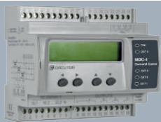
MDC-4 Délesteur prioritaire

LE TARIF BLEU LE TARIF JAUNE Jusqu'à 250kVA (400A)